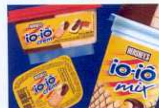
Embalagens renovadas pela M Design

volume e luminosidade por meio do contorno branco em torno da inscrição azul. Foram também desenvolvidos displays que garantem a visibilidade dos produtos e ressaltam a comunicação nos pontos-de-vendas. Tel.: (11) 3833.0969 ◆